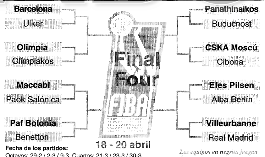
Los equipos en negrita juegan dos veces en casa

Árbitros: Romualdas Brazauskas (Lit.) e Ilija Belosevic (Yug.). Sin eliminados.