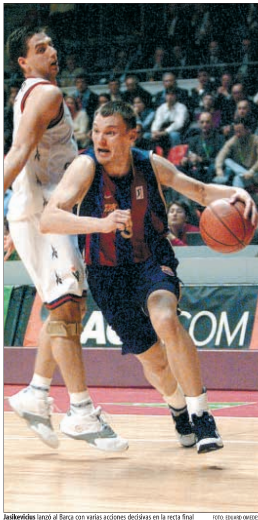
Jasikevičius lanzó al Barça con varias acciones decisivas en la recta final